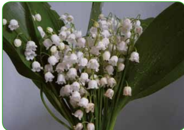
Šmarnica je primerna za polsenco. Danes poznamo rastlino tudi v roza barvi.