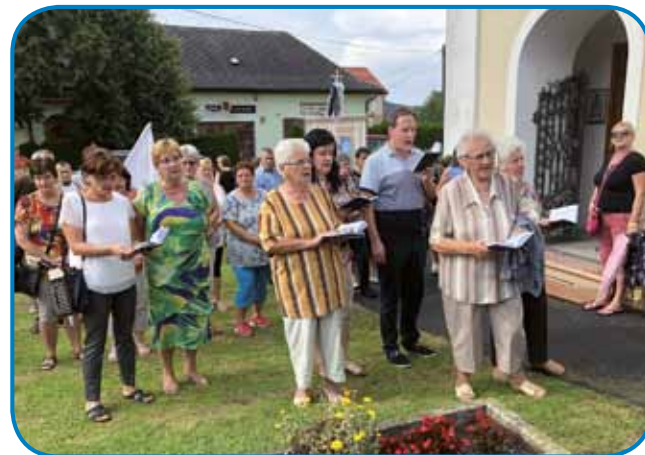
Božepautnike so pred kapejlov v Slovenskoj vesi z Marijinimi pesmimi pozdravile domanje ženske