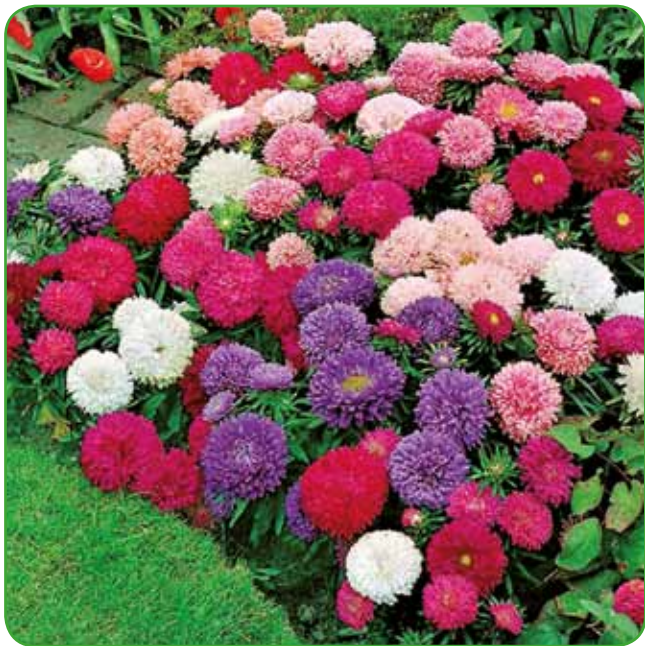
Naše babice so že od nekdaj vedele za veliko vzdržljivost poletnih aster

rati, vendar so bile sadike za presajanje z močnim koreninskim sistemom. Prav rada se spominjam teh vzdržljivih rož, saj imam z njimi posebno