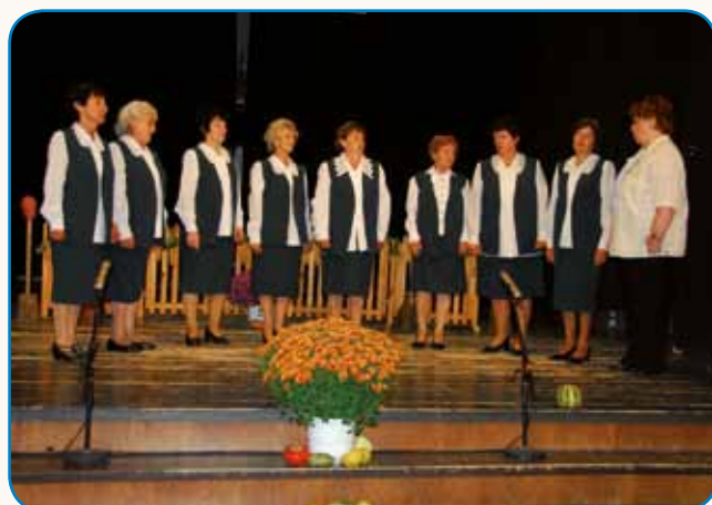
Trno aktivna Porabska Slovenka stran 6-7