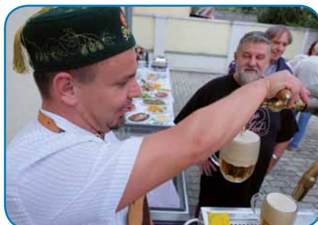
Čas sprostitve. V vročini se prileže pivo, še bolj, če ga toči »mojster«. Utrinek s konzulata