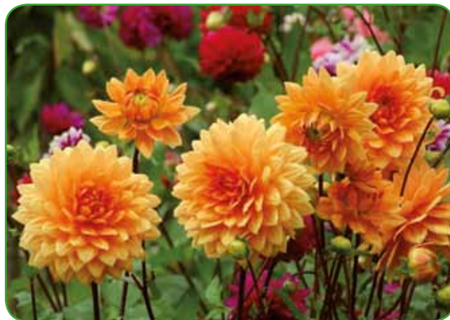
Dalije ali georgine imajo sicer gomolje, vendar cvetijo do pozne jeseni

doba je dolga. Na istem mestu preživijo več generacij. Zaradi njihove lepote se selekcija širi. Danes dobimo na trgu veliko sort v raznih barvah.