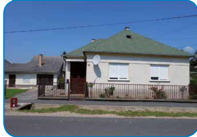
Kauki iže na sređdi Slovenske vesi je vsigdar red

»Tak je bilau, sto je vedo tau naprej, ka baude. Zavolo