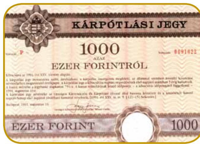
Té vrednostne papére je po leti 1991 madžarski rosag vödau tistim, šterim so v preminaučom sistemi kaj krajuzeli

V vinešnoj politiki je ranč tak vse ovaško gratalo. Februara