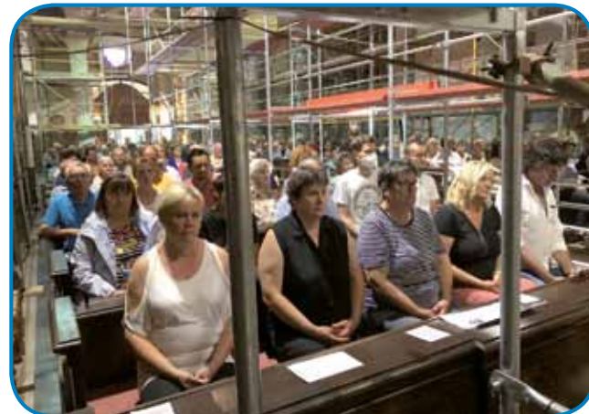
Cerkve Marijinoga vnebovzetja v Varaši se je na farni svetek cejlak napunila

Na konci svete meše so zbrani vörnícke - vküper s prauškarami s Porabja, Goričkoga ino vogrské vesnice Halogy - zmolili molitev sombotelskoga püšpeka dr.