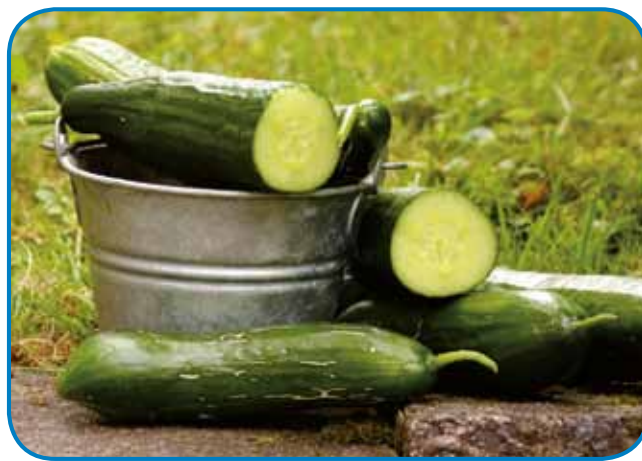
Kumare zavzemajo pomembno mesto v prehrani kot sezonska sveža povrtnina in tudi kot zimska vložena solata

jih izdatno gojijo na njegovih posestvih. Kasneje je bil velik privrženec kumaric Sončni kralj Ludvik XIV., užival jih je v juhi ali solati. To tudi danes počenjajo njegovi Francozi: kumare narežejo na tanko kot las, jih pomešajo z oljem, vinskim kisom in ščepcem soli ter jih posujejo z drobnjakom in peteršiljem.