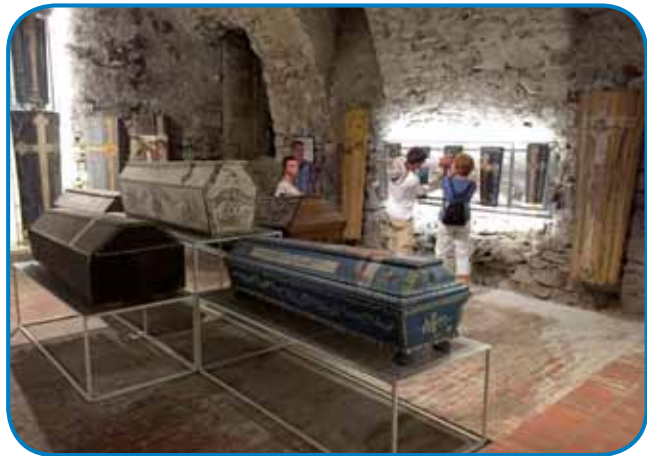
Srejdnjeveška zamenica v Váci - s pofarbanimi mrtvečimi škrinjami

me skoro cejlak gorostala. Med njimi najdemo moške, ženske ino mlajše, majstre, barate ino duhovnike, sodačke oficere ino fiškališe.