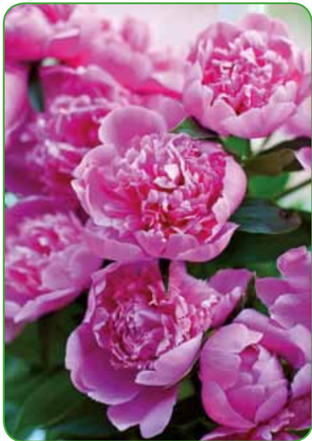
Šopek potonik se v vazi s platico zelo dolgo obdrži. Režemo jih, ko komaj kažejo barvo.

Tudi v mojem otroštvu so mi ostale v spominu: alojzijeve lilije, poletne astre, potonike (betlehem), srčki, šmarnice in druge. To cvetje je bilo na vrtu od nekdaj in smo ga z