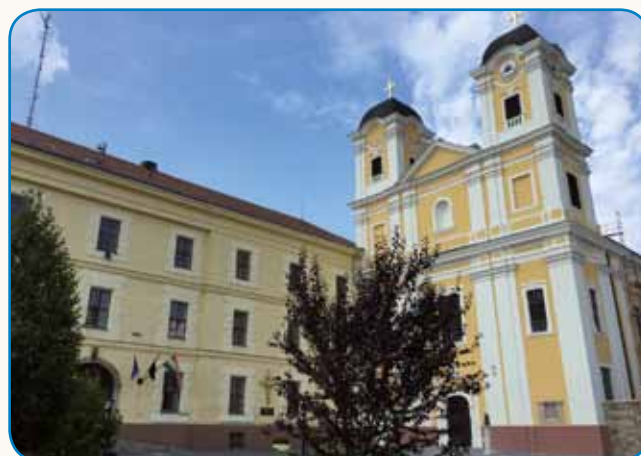
Škrinje pod zemlavo, robi v klaustri stran 9