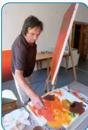
19. kolonijo je zaznamoval covid-19 stran 3

»Gda démo domau s prauške, démo cejlak ovaški«