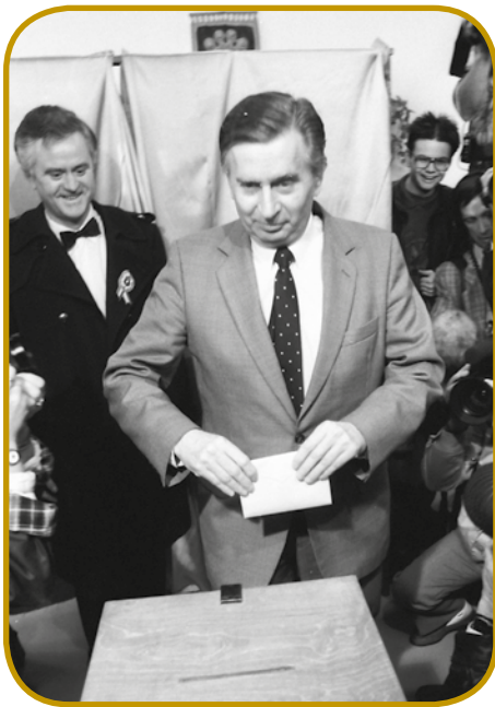
Predsednik MDF József Antall dojda svoj glas 25. marcüša 1990, na prvi demokratični volitvaj

Od novembra 1989 so se na Madžarskom nalečüvali na slobaudne volitve (választások). Rivalstvo je nej samo med nauvov socialističnov strankov MSZP ino opozicijov bilau, liki med radikalnim prautikomuništarskim SZDSZ ino konservativno-