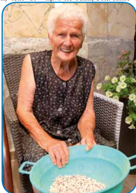
Tetica Mariška so ranč gra prebirali, gda sem je gorapoisko

Reckina Mariška, po možej Sömenek, v Slovenski vesi živejo z možaum, leko bi pravli, ka tak po starom, lopau, mirno. Kak tetica pripovedajo, zato so se cejlak še nej tazanjali, majo šiške (svinje), stere mauž polaga, pa kokauši tō, stere pa oni majo na brigi. Leta 1956, gda je revolucija bila, gda je vsikši na tejm zmišlavo, aj dé vō z rosaga ali aj ostane, oni so se te, novembra