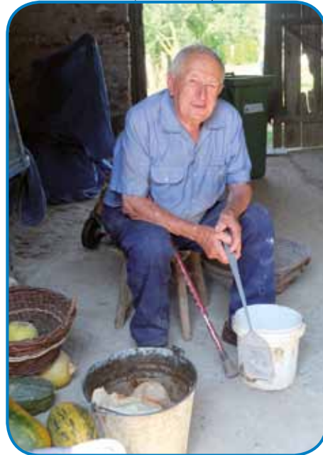
Mauž pripravla gesti za šiške (svinje)

nej malo. Sledkar, gda smo od zadruga dobili njive nazaj kak odškodnino, te smo je